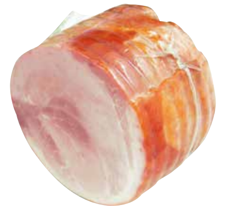
MINI PROSCIUTTO DI PRAGA SIEBENFORCHER Delizioso prosciutto di praga dal sapore unico.

Peso medio per pezzo: 1,5 Kg cod. 690266