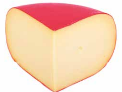
GOUDA TEDESCO Formaggio fuso a pasta gialla adatto per la cucina messicana.