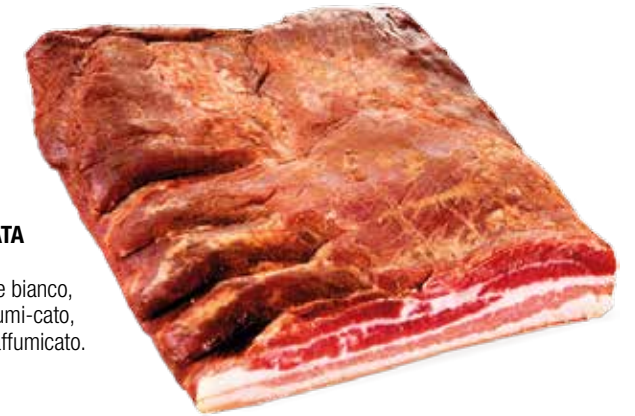
BACON/PANCETTA AFFUMICATA SANT'ORSO Pancetta cruda di colore rosato e bianco, sapore delicato leggermente affumi- cato, odore caratteristico di prodotto affumicato.

Peso medio per pezzo: 1,5 Kg cod. 690266