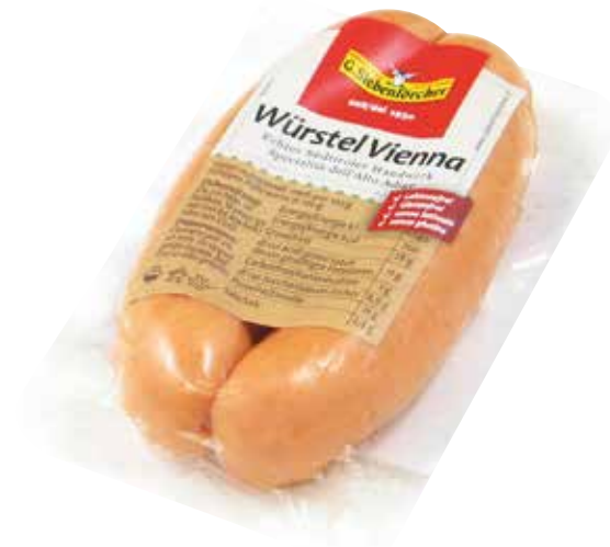
WIENER WURSTCHEN SIEBENFORCHER Wurstel Vienna affumicato senza glutine e senza lattosio. Peso per pezzo: 95 g Pezzi per confezione: 2 cod. 960542