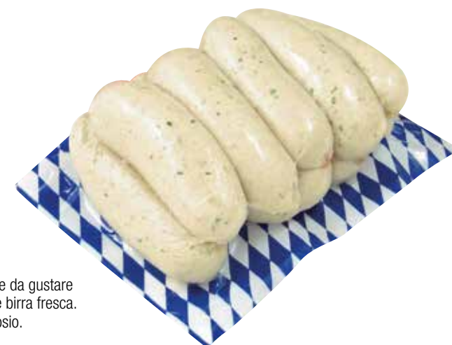
MINI WEISSWURST SIEBENFORCHER Wurstel specialità bavarese da gustare con senape dolce, brezel e birra fresca. Senza glutine e senza lattosio. Peso per pezzo: 80 g Pezzi per confezione: 10 cod. 960544