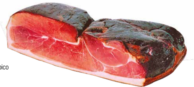
PROSCIUTTO CRUDO FORESTA NERA Prosciutto crudo affumicato tipico della foresta nera.

Peso medio per pezzo: 2,5 Kg cod. 690311