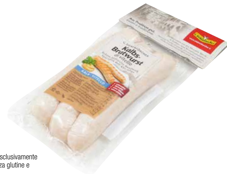
BRATWURST VITELLO SIEBENFORCHER Wurstel cotto prodotto esclusivamente con carne di vitello. Senza glutine e senza lattosio. Peso per pezzo: 185 g Pezzi per confezione: 3 cod. 960543